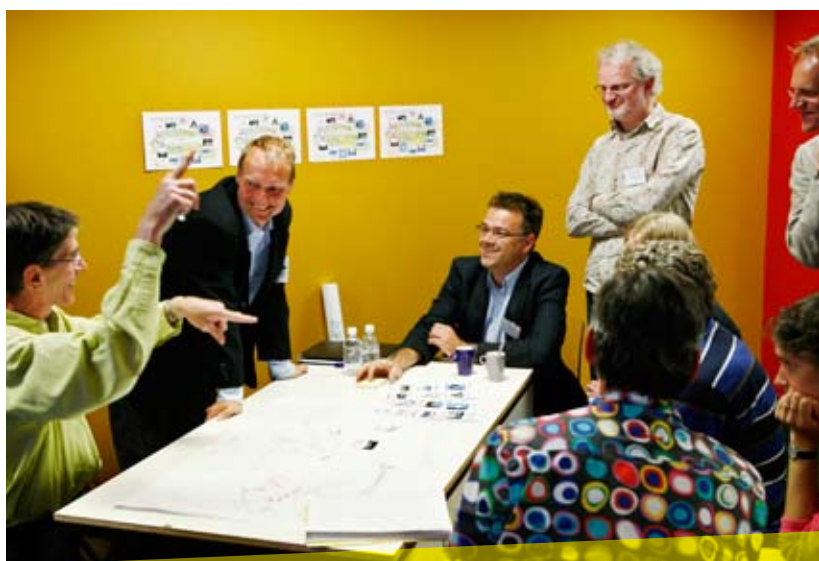
Geanimeerde discussie in het middagprogramma