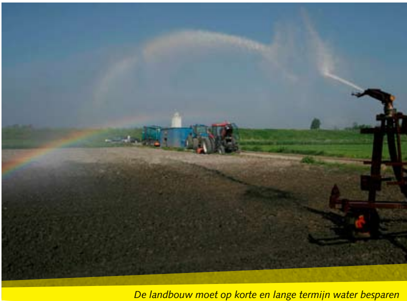
De landbouw moet op korte en lange termijn water besparen

Geert Hermans van de Zuidelijke Land- en Tuinbouw Organisatie (ZLTO) presenteerde het WOP, al bijna een eigenaam voor Water Optimalisatie Plan. Dat plan komt voorlopig neer op een onderzoek dat antwoord moet geven op de vraag hoe groot de watervraag per bedrijf en per regio in Zeeland over twintig jaar zal zijn. Volgens Hermans, sectorspecialist fruitteelt bij de ZLTO, wordt water als productiefactor op bedrijfsniveau steeds belangrijker. De sector neemt teeltmaatregelen die de afhankelijkheid van water steeds groter maken. Kortom, de watervraag neemt nu al toe. Om te kunnen anticiperen op de gevolgen van de klimaatveranderingen is veel meer inzicht nodig in het patroon van de werkelijke waterbehoeften van agrarische bedrijven. Om dat inzicht te krijgen heeft de ZLTO het Water Optimalisatie Plan ontwikkeld. Hermans: 'Op dit punt is nog een wereld te winnen. De glastuinbouwer is zich redelijk bewust van zijn watergebruik, de akkerbouwer doorgaans niet. Vandaar ons initiatief. Want als we als sector willen meepraten over de toekomst, dan moeten we toch eerst zelf weten waarover we het hebben. Daar gaat het WOP voor zorgen.'