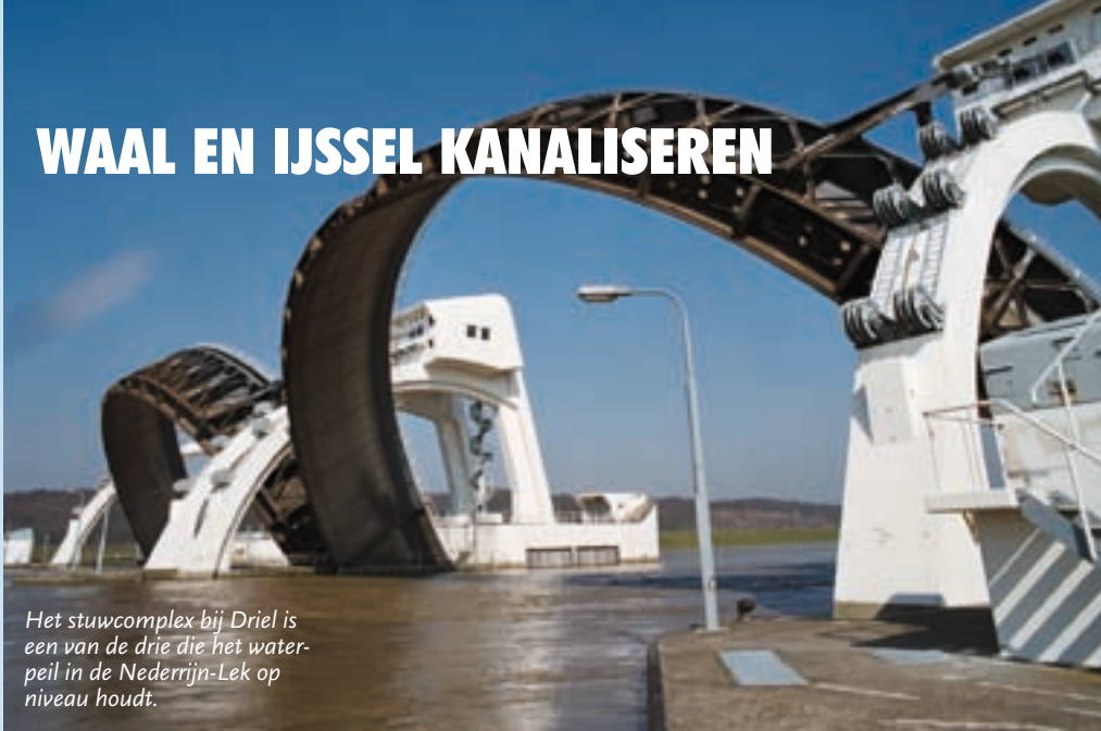
Het stuwcomplex bij Driel is een van de drie die het waterpeil in de Nederrijn-Lek op niveau houdt.