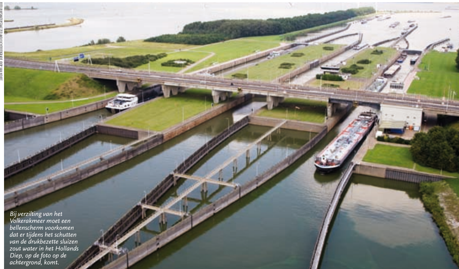
Bij verzilting van het Volkerakmeer moet een bellenscherm voorkomen dat er tijdens het schutten van de drukbezette sluisen zout water in het Hollands Diep, op de foto op de achtergrond, komt.