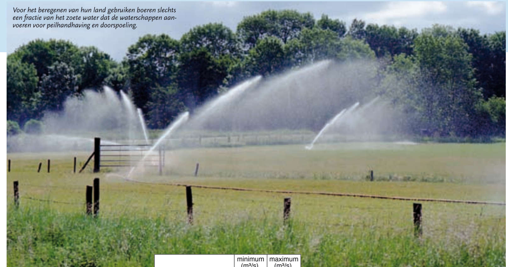
Voor het beregenen van hun land gebruiken boeren slechts een fractie van het zoete water dat de waterschappen aanvoeren voor peilhandhaving en doorspoeling.

kanalisisatie, over wat het meeste profijt biedt zijn de uitkomsten zeer onzeker.' Er zijn ook andere opties denkbaar, bijvoorbeeld de ontwikkeling van lichtere schepen of duwbakcombinaties met minder diepgang. 'Het achterwege laten van kanalisatie zou de scheepvaartsector bij vaker voorkomende droge zomers tot aanpassen kunnen bewegen. De branche is er inventief genoeg voor.'