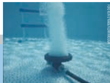
Schematische voorstelling van de werking van een bellenscherm bij een schutsluis, gecombineerd met zoetwaterinjectie. De inzet toont een sproeikop die bellen produceert.

Haringvliet komt, een van de belangrijkste zoetwateraders van Zuid-west-Nederland. Het bellenscherm is niet nieuw; tot nu toe werd daarvoor een buis met gaatjes gebruikt. 'Dat werkt echter niet optimaal', weet Paggée, die de proef begeleidt. 'Wij gaan nu sproeikoppen met drukverdelers gebruiken die een veel dichtere bellenscherm creëren, en combineren dat met zoetwaterinjectie.' De proef met het scherm gaat in februari 2010