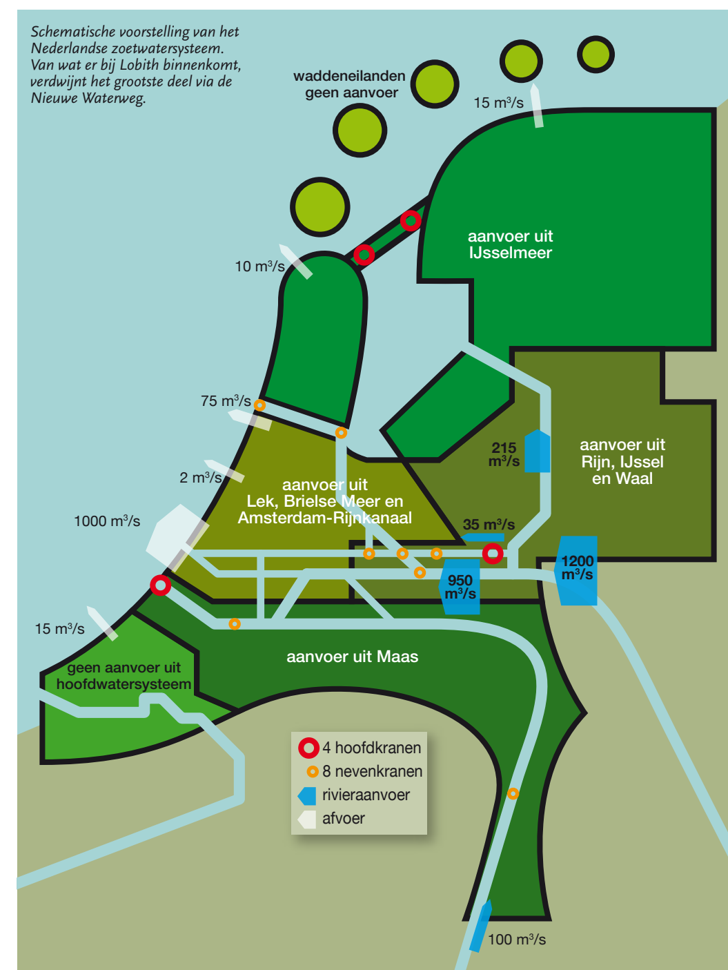
ILUSTRATIE: BOUW OVERZICHT

Het extra aanbod in droge zomers zal dus van elders moeten komen. Van Waveren was ook een van de deskundigen die een belang-