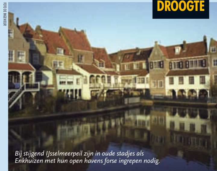
Bij stijgend IJsselmeerpeil zijn in oude stadjes als Enkhuizen met hun open havens forse ingrepen nodig.

grote buffer moet hebben', zegt Roosjen. 'Want er kan zich langere tijd een situatie voordoen van een hoog zeeniveau gecombineerd met zware regenval. Spuien kan dan niet, maar je moet het water toch kwijt.' Hij vindt het daarom niet terecht dat de commissie-Veerman de mogelijkheid van het gebruik van pompen in de Afsluitdijk op voorhand heeft afgewezen. 'Met gemalen ben je niet meer afhankelijk van vrij verval. Dat geeft een veel grotere speelruimte in het peilbeheer en daarmee ook voor de zoetwatervoorziening.' www.helpdeskwater.nl www.deltacommissie.com